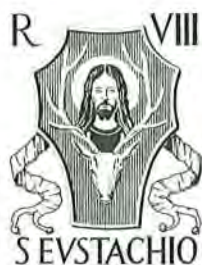
3. Lo stemma del rione Sant'Eustachio, una testa di cervo d'oro con il busto di Cristo, in campo rosso.

dono della cerbiatta, offerto dalla diaconia di sant'Eustachio, è spiegabile, poiché il cervo fa parte della leggenda di sant'Eustachio ed è rappresentato nel suo vessillo. Ma, detto questo, il mistero rimane. Infine, la difficoltà di interpretazione trova un suo momento culminante nella fase finale della celebrazione, quando un prete della diaconia, accompagnato dal sacrestano, fa il giro delle case per la benedizione pasquale. Qui, infatti, si ritorna pienamente nella dimensione del sacro, ma il sacrestano è ancora vestito come un satiro e canta a squarciagola versi senza significato. Così si ha contemporaneamente una benedizione e una manifestazione ludica.