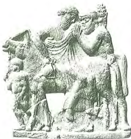
1. Dioniso è aiutato da un sileno a sdraiarsi su un asino. Rilievo melio proveniente da Atene, secolo V (metà). Berlino, Staatliche Museum.

non significa più nulla. La datazione di questa festa, cioè il periodo in cui fu certamente vitale, è di individuazione relativamente semplice. Da un lato, come già si disse, sappiamo che essa rimase nell'uso fino alla seconda metà del secolo XI, cioè al pontificato di Gregorio VII. Dall'altro, conosciamo un termine intermedio, che è con sicurezza l'876. In questo anno, infatti, Giovanni Immonide, un diacono della Chiesa romana, completò la sua traduzione in versi della Coena Cypriani , un'opera del secolo III 6 . Nella terza quartina dell'esordio egli suggerì di recitare il suo rifacimento in un preciso momento dell'anno: