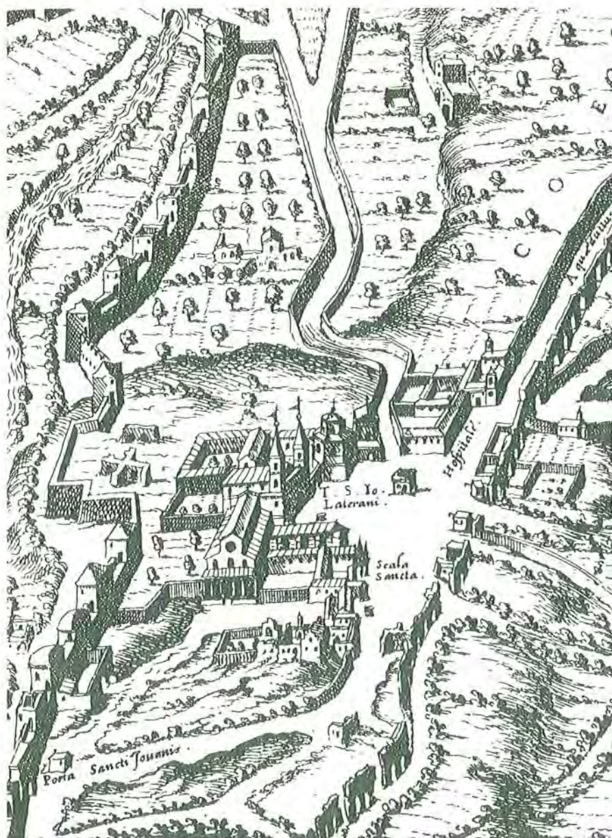
2. La zona del Laterano in cui si celebravano le Laudes cornomannie . Particolare della pianta di Roma del Dupérac (1577).

re 8 . Nelle nostre Laudes cornomannie tutto ciò raggiunge un paradosso assoluto: colui che veniva preso in giro, che montava su un asino al contrario, proprio come Sileno (o come Dioniso?), che si cimentava in un buffo gioco di abilità, non era un bambino o un personaggio di scarso peso sociale. Al contrario egli era, anticamente, il capo dei chierici del coro papale e, in seguito, il capo di una ricca e prestigiosa canonica accompagnato dal suo sacrestano, quest'ultimo abbigliato come una specie di satiro 9 . La situazione è ancora più complicata nel proseguimento della festa. Se infatti il dono delle corone al papa era normale, quelli enigmatici di una cerbiatta, di un gallo e di una piccola volpe rendono il papa stesso protagonista di un evento assolutamente fuori delle norme. Forse solo il