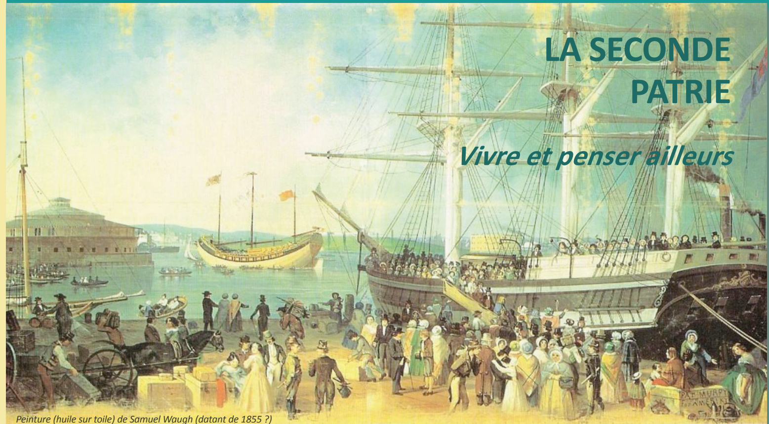
Peinture (huile sur toile) de Samuel Waugh (datant de 1855 ?)